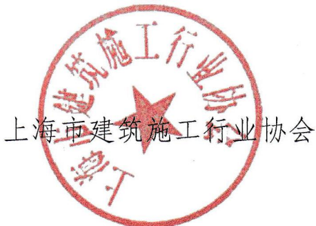
上海市建筑施工行业协会