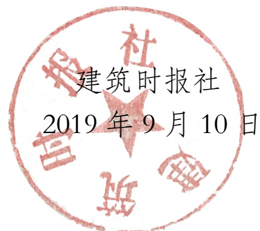
建筑时报社 2019年9月10日